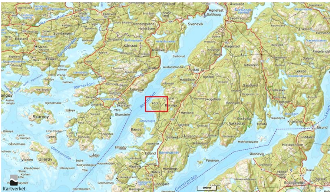
Figur 1 Oversiktskart. Planområdet vist med rød firkant (ikke i målestokk)

Planområdet ligger i Bordviga ca. 5,5 km ute i Rosfjorden i Lyngdal kommune.